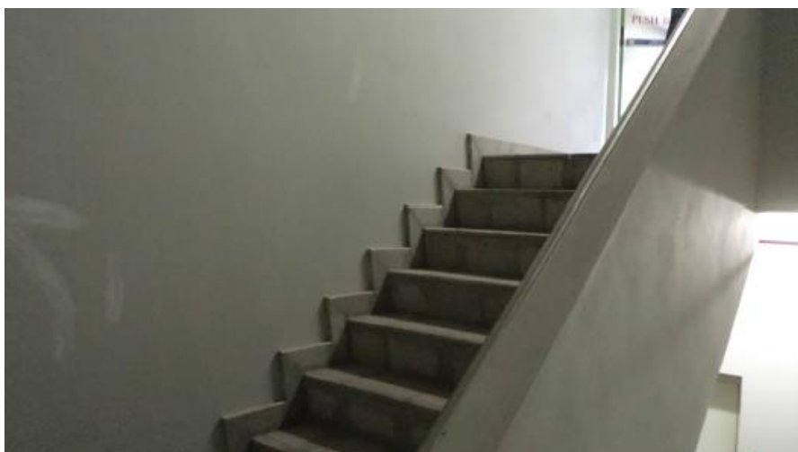
รูปที่ 9 แสดงทางหนีไฟ