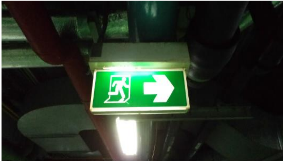
รูปที่ 10 ป้ายทางหนีไฟ