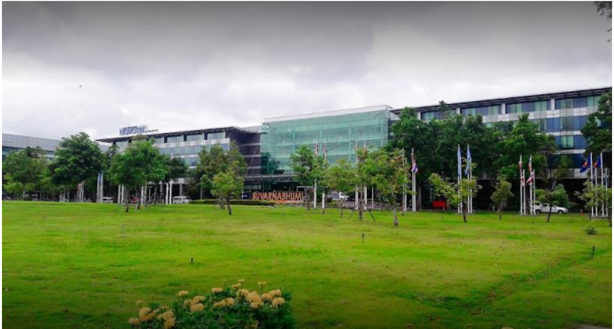
รูปที่ 13 จัดสวนหย่อม และใช้พันธุ์ไม้พุ่มเป็นส่วนใหญ่