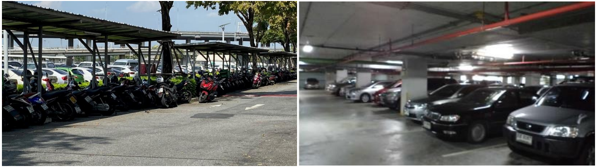
รูปที่ 4 พื้นที่จอดรถได้จัดเตรียมไว้โดยรอบอาคารโรงแรมและบริเวณชั้นใต้ดินของอาคาร