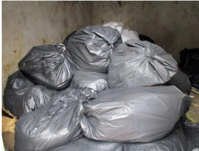
รูปที่ 7 มวลฝอยรวบรวมและบรรจุในถุงดำ พร้อมมัดปากถุง