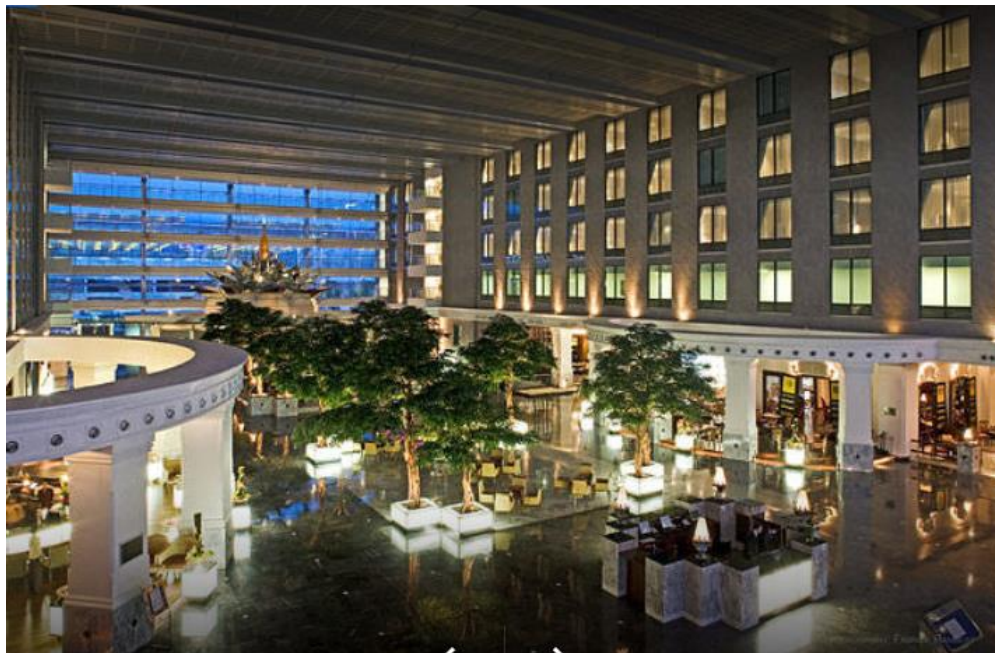
รูปที่ 5 โถงห้องรับแขก (Lobby) สามารถรับลมและแสงธรรมชาติได้ดี