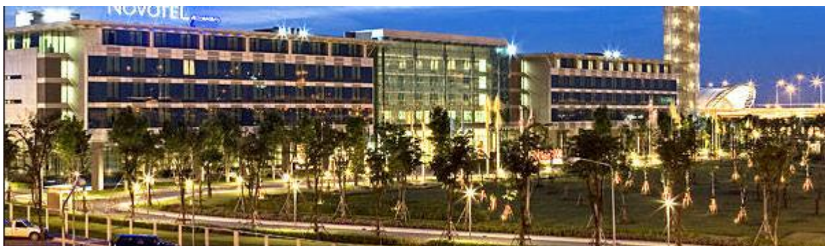
รูปที่ 6 ดวงโคมชนิดที่มีแผ่นกระจายแสงที่เสาบริเวณริมถนนโดยรอบอาคาร