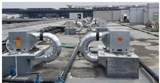
รูปที่ 11 เครื่องดูดควันไฟในกรณีเกิดเพลิงไหม้