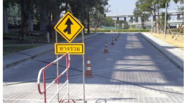
รูปที่ 1 แสดงทางเดินรถ ป้ายจราจรต่างๆ