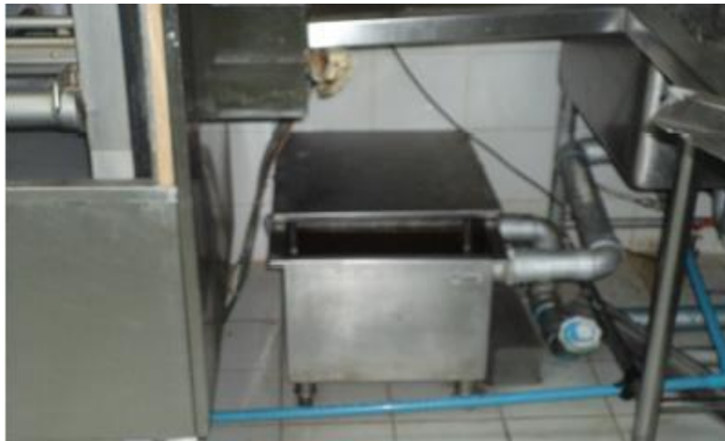
รูปที่ 2 แสดงถังดักไขมันใต้อ่างล้าง