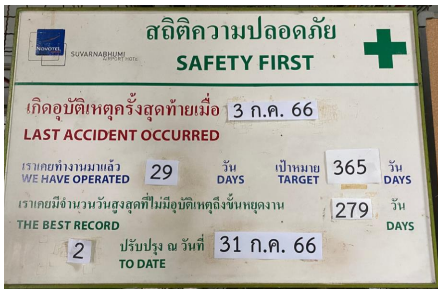
รูปที่ 12 ทำป้ายสถิติความปลอดภัยในการทำงาน