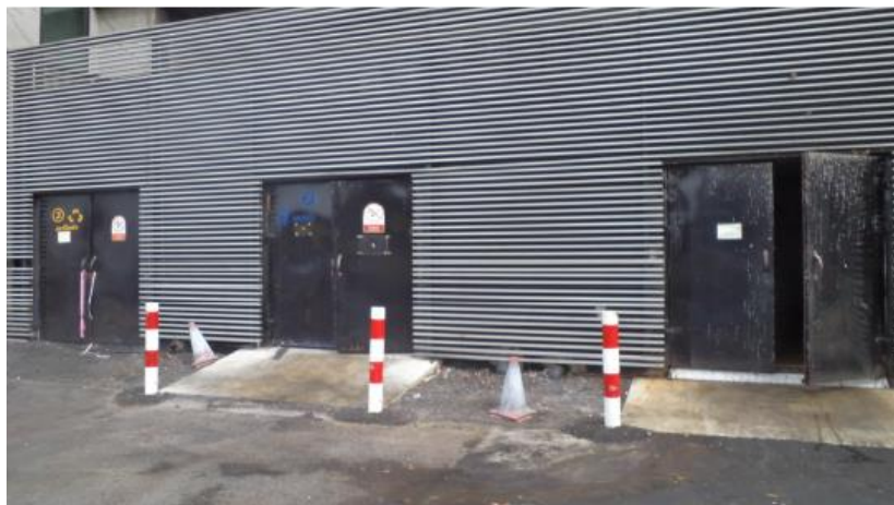
ห้องพักขยะ รีไซเคิล ขยะแห้งและขยะเปียก